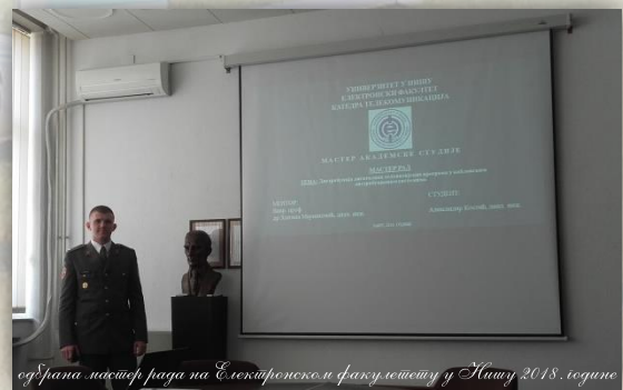
одржања мастер рада на Електронском факултету у Нишу 2018. године