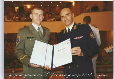
додеља дипломе на Војној академији 2015. године